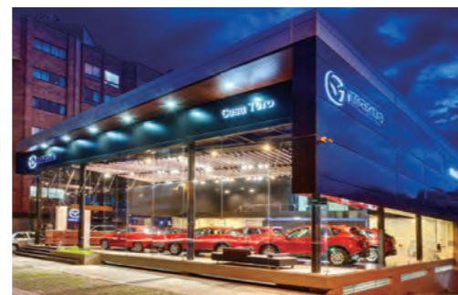
コロンビアの首都ボゴタ市内の新世代店舗