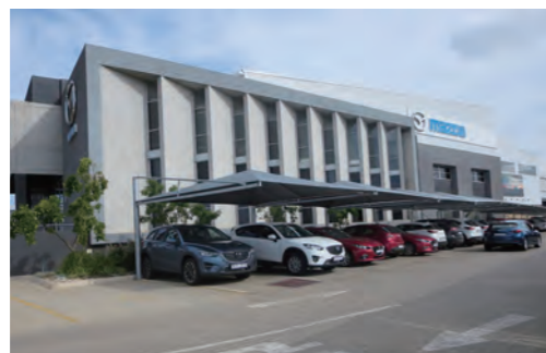
マツダサザンアフリカ本社