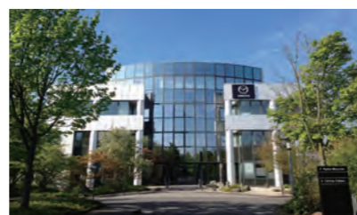
マツダヨーロッパGmbH(MME) 外観