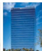
マツダノースアメリカンオペレーションズ(MNAO)外観