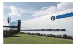
マツダデメヒコビークルオペレーション(MMVO)外観

※「マツダモーターオブアメリカ, Inc.」「マツダモーターデメヒコS. de R.L de C.V.」を総称して「マツダノースアメリカンオペレーションズ(MNAO)」と呼んでいる