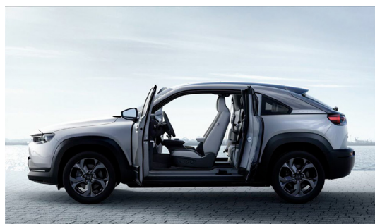
Fig. 1 Freestyle Door

この車の最大の特長のひとつが、センターオープン式のドア構造を実現したフリースタイルドアである (Fig. 1)。